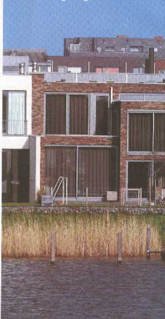
Gelegen aan het Markermeer is IJburg geliefd onder watersporters. Enkelens hebben zelfs een eigen steiger

oranje-rood, zachtgeel: de huizen in de Brabantse wijk Watertuinen vertonen een rijk kleurenpalet. De woningen hebben ook mooie balkons, verzorgde tuinen en veel zowel grote als kleine ramen, zodat de bewoners kunnen genieten van het uitzicht over weilanden met boerderijen. Of over het water. Bijna elk huis heeft een steiger waaraan een bootje ligt gemeerd.